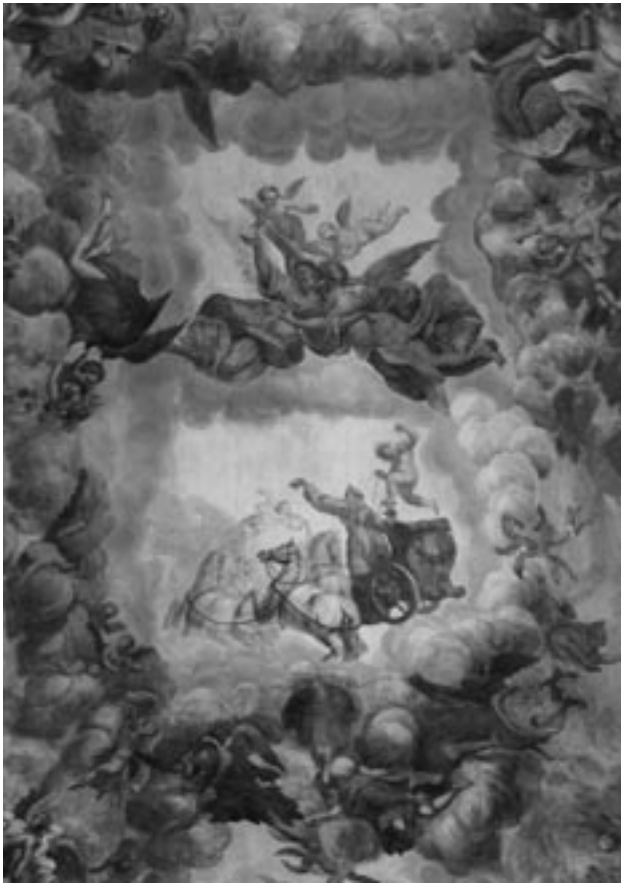
Фрагмент розписів у Бернардинському костелі у Львові (сучасна церква Св. Андрія). Автори – Бенедикт Мазуркевич, А. Бартницький, П. Срочинський, П. Волінський. 1738–1740 рр.

ли чергові скарги на нього у 1771 р. [57] Розпочатий цеховими майстрами новий судовий процес проти монументаліста знову увінчався перемогою маляра.